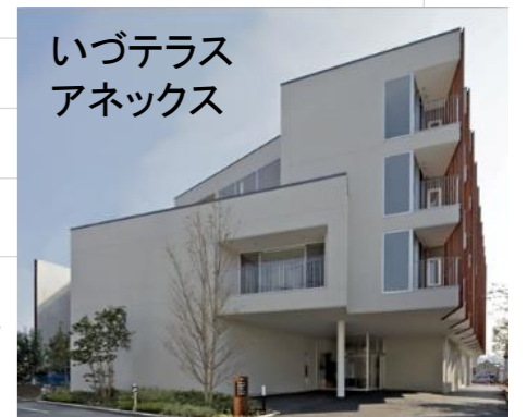
いづテラス アネックス