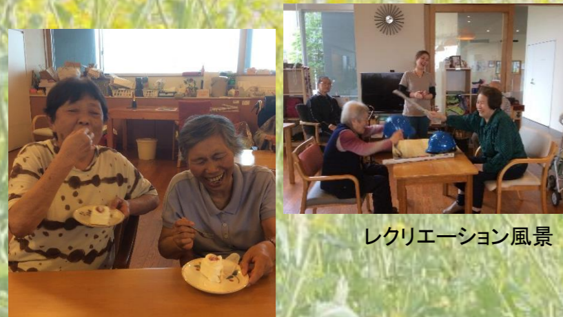
レクリエーション風景