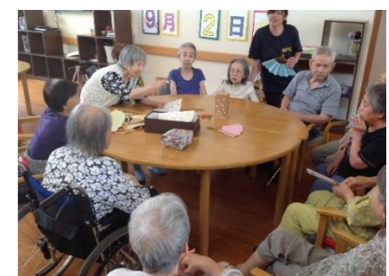
レクリエーション風景